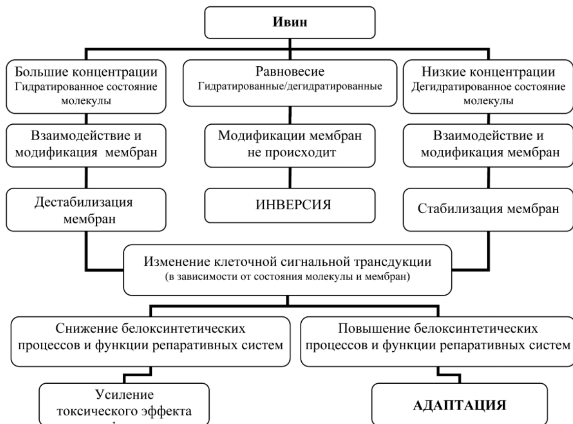
Рис.3. Возможный механизм нелинейных эффектов регуляторов роста растений – производных N-оксид пиридина

зация мембран (уплотнение липидов), при этом также наблюдается изменение клеточной сигнальной трансдукции, повышение белоксинтетических процессов и функции репаративных систем, что ведет к адаптации.